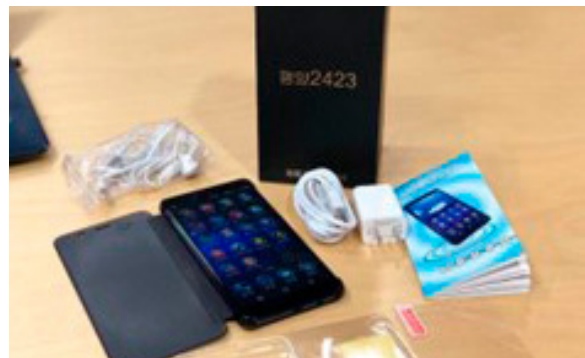
&lt;북한 최신형 스마트폰 평양 2423 (한겨레신문)&gt;

어느 날은 집에 있는데 뜬금없이 보위부 직원이 핸드폰을 들고 우리 집에 찾아왔다. 표면적으로는 핸드폰에 녹음되어 있는 중국말을 해석해달라고 요청한 것이었으나, 나는 본능적으로 나의 반응을 보려는 술수라는 것을 알아차렸다. 내가 핸드폰에 관심이 있는지, 그리고 중국에 가는 것에 대해 관심이 있는지 관찰하려는 수법이었는데, 지금 생각해 보면 직관적으로 그런 순간 순간에 내가 지혜롭게 대처할 수 있도록 하신 은혜에 참 감사하다. 핸드폰에 녹음된 내용을 들어보니 어떤 북한 여성이 중국 말로 “중국에 가고 싶다. 이곳 생활이 어려워니 중국 돈 얼마를 보내 달라.” 라고 통화한 내용이었다. 나