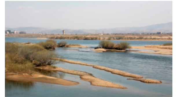
&lt;중국과 북한 사이를 흐르는 압록강 국경지대 모습&gt;

죽음을 무릅쓰고 탈북하기를 원할 정도로 그곳에서 산다는 것이 참 어려웠다. 남편이 가지 않으면 나 혼자라도 탈출해야겠다는 생각을 했다. 출소한지 1년이 넘는 시점부터는 감방 동기들이 사는 옆동네를 자주 오가며 브로커들과의 인맥을 쌓기 시작했다. 가끔씩 브로커들을 도와 사람들을 데리고 보위지도원들 몰래 중국에 있는 가족들과 연락이 닿도록 돕는 일을 했다. 중국과 같은 외부 세상과 연락을 하려면 깊은 산 속에 올라가야 했는데 그러려면 의심받지 않도록 화전민 행세를 하며 허름한 옷과 운동화, 호미 또는 낫과 같은 도구를 준비해야 했다. 꼭두새벽부터 나가서 산을 타면 중국이 내다보이는 도착 지점에 점심 즈음 도착하고, 연락을 한번 하고 내려오면 하루