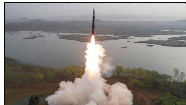
<고체연료 ICBM 화성-18호>