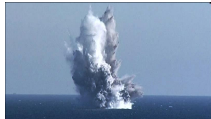
<수중 핵어뢰 '해일' 수중 폭발시험>

날이 갈수록 고도화되는 북한의 군사 위협을 생각할 때, 한반도의 평화를 위한 기도가 더욱 요청됩니다. 한반도의 군사적 긴장이 완화되고 평화가 증진될 수 있도록, 남북을 비롯한 각 국의 지도자들이 하나님을 경외하며 바른 결정을 할 수 있도록 기도합시다