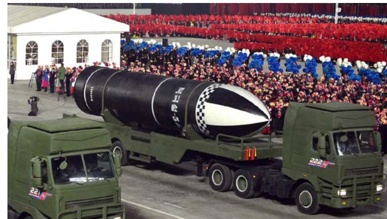
제 8차 당대회에 이어 열린 열병식에서 공개된 SLBM 북극성 5-스

그렇지만 하나님의 경륜은 사람의 생각을 초월하여 북한의 변화를 이끌어 내시는 줄로 믿습니다. 비핵화가 평화적인 방법으로 진전을 이룰 수 있도록 기도합니다. 북한의 폭압적인 통치가 변화되고 북한에 복음의 문이 더 크게 열릴 수 있도록 함께 기도합니다.