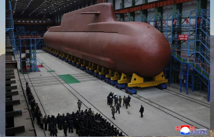
북한이 지난해 성탄절 공개한 8700톤급 전략핵잠수함

핵보유국을 꿈꾸는 북한의 전략이 성공하지 못하도록, 한반도가 북한이 말하는 대결의 장이 아닌 평화의 공간이 되도록 기도합니다. 각국의 주요 지도자들이 하나님을 경외하는 가운데 바른 의사결정을 할 수 있도록 기도합니다. 역사의 주관자이신 하나님의 뜻이 한반도 가운데 온전히 이루어지도록 기도합니다.