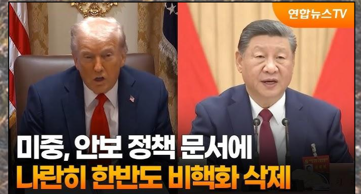
미중, 안보 정책 문서에 나란히 한반도 비핵화 삭제